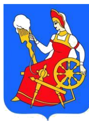
Рис. 2. Герб города Иваново

На все иллюстрации в тексте должны быть даны ссылки.